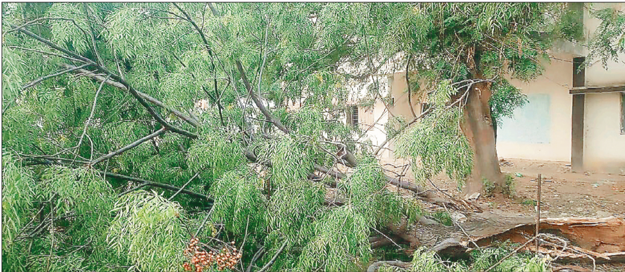
आए आंधी ने वृक्ष इस तरह हो गए धराशायी।