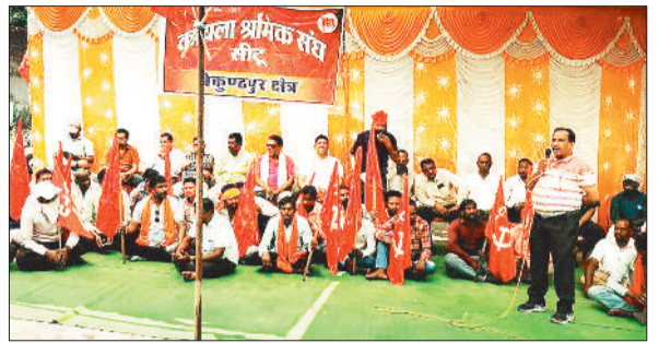
धरना प्रदर्शन करते ठेका श्रमिक।