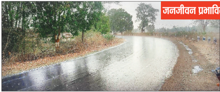
हो रही बारिश से भीगी सड़क।

सोमवार को सुबह से ही मौसम खुशनुमा बना रहा और हल्के बादल आसमान में छाए रहे, इसी बीच जिले के कुछ क्षेत्रों में पानी की बड़ी-बड़ी बूँदें गिरने लगी, कहीं हल्की बूढ़ाबांदी हुई तो कहीं पर तेज बौछार पड़ी। जानकारी के अनुसार सोमवार को सुबह करीब 10 बजे के लगभग जिले के कई क्षेत्रों में