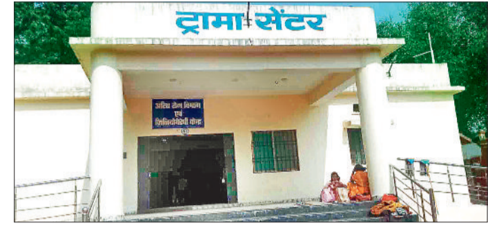
मेडिकल कॉलेज अस्पताल का ट्रामा सेंटर।